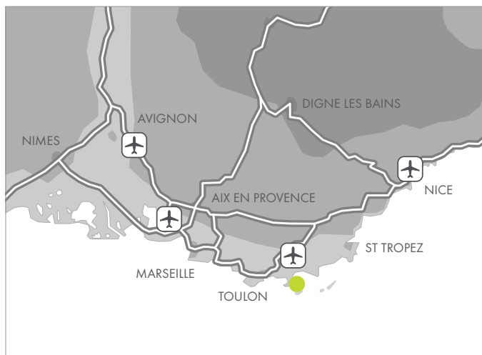
2 - DANS LA RÉGIONS PROVENCE ALPES CÔTE D'AZUR ...